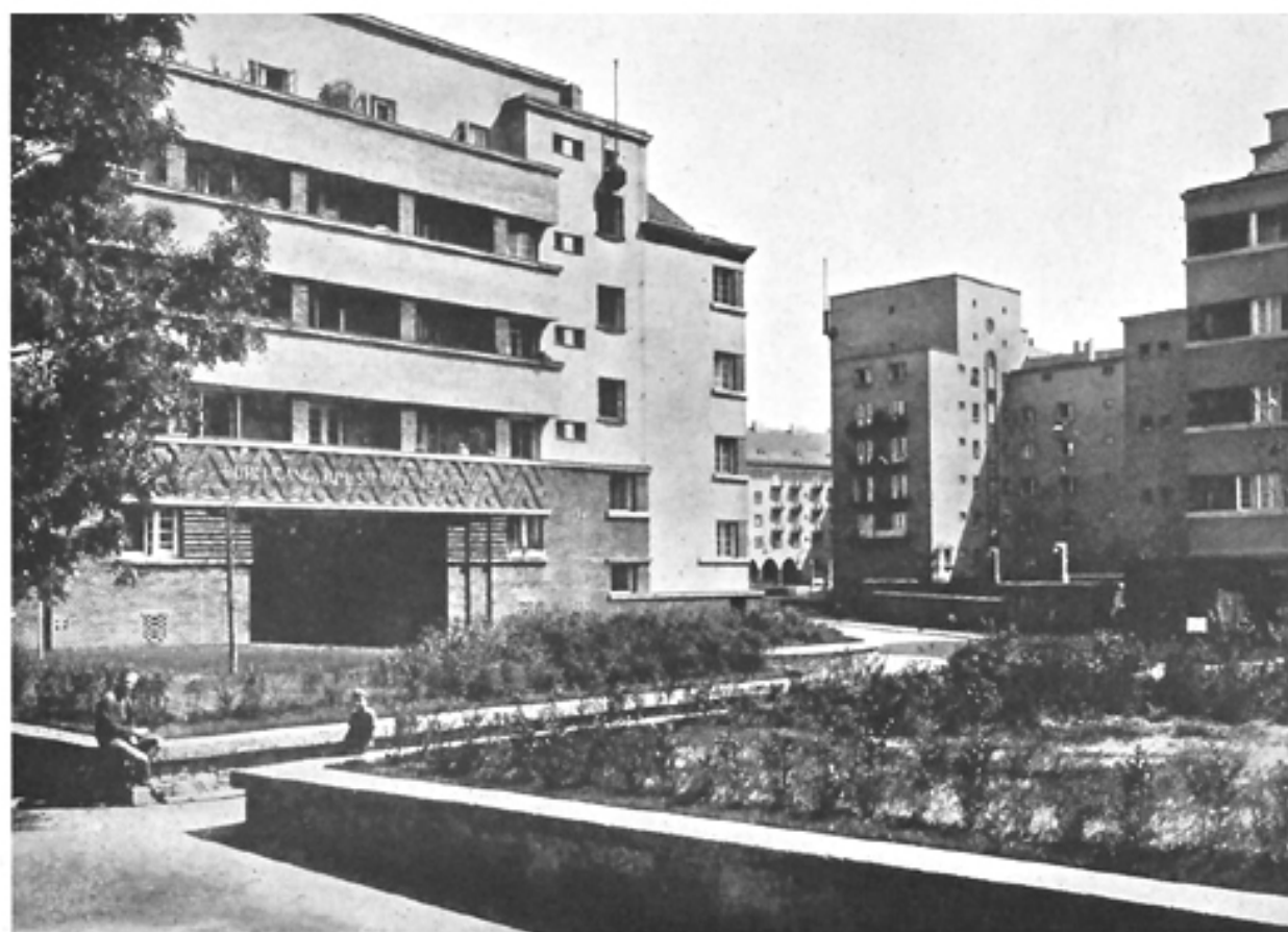
Neue Wohnhausanlage, III. Bez., auf den Gründen der ehemaligen Krimsky-Kaserne (Blick gegen die Rabengasse)