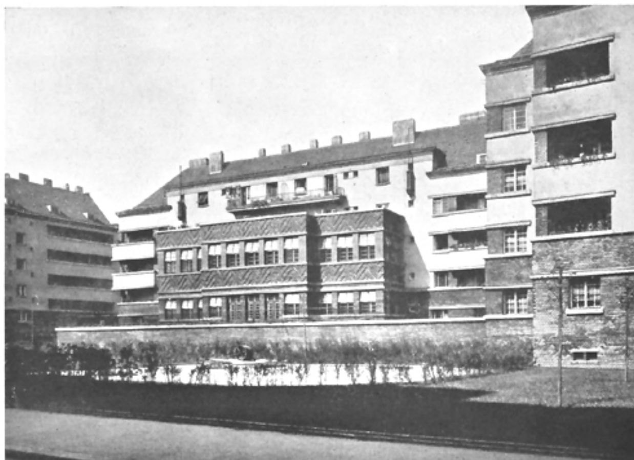
Neue Wohnhausanlage, III. Bez., auf den Gründen der ehemaligen Krimsky-Kaserne (Nikolausplatz, Blick gegen den Kindergarten)