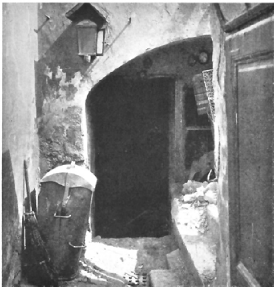
Haus, III. Bez., Hainburgerstraße (alter Bestand)