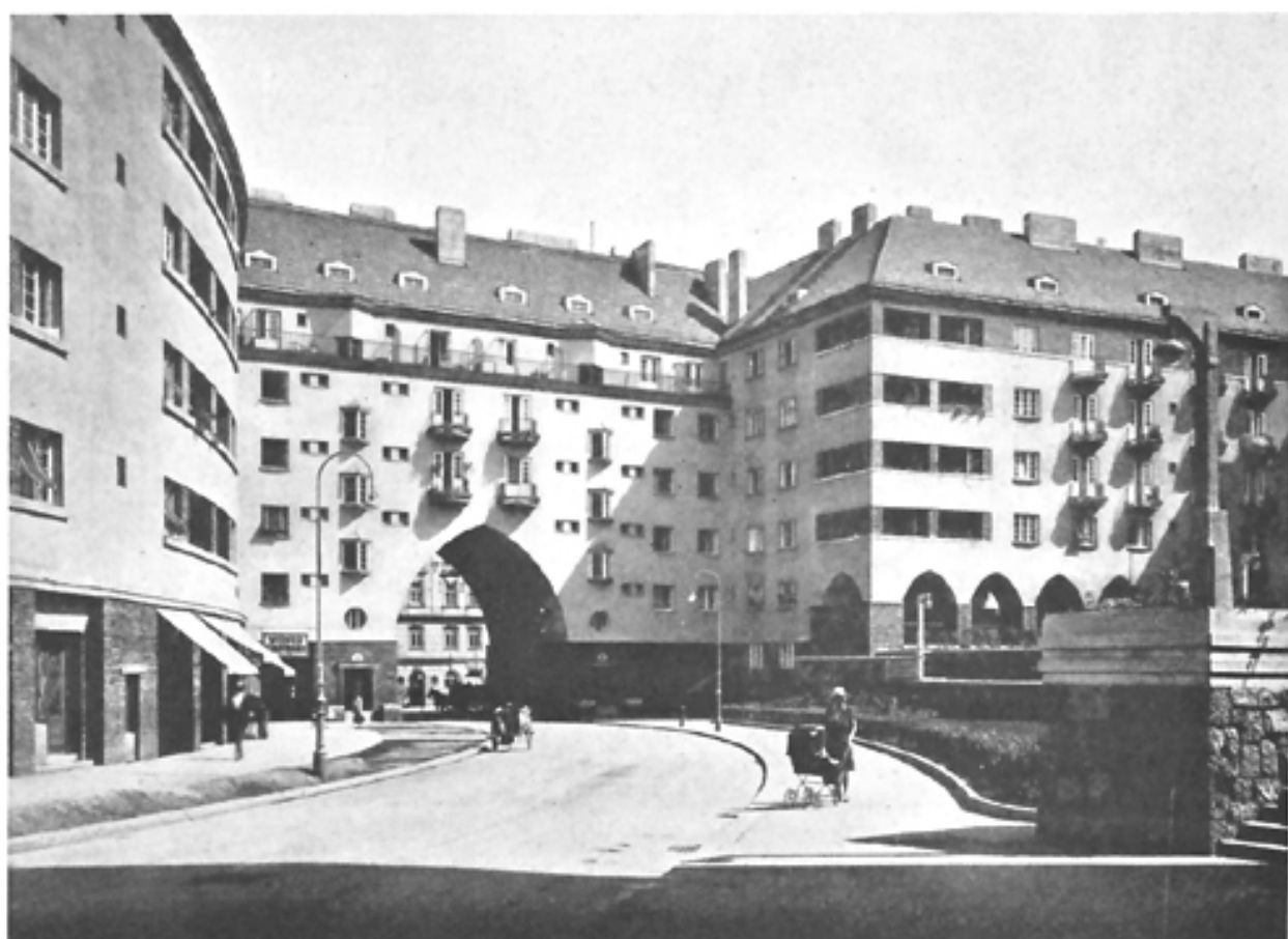
Neue Wohnhausanlage, III. Bez., auf den Gründen der ehemaligen Krimsky-Kaserne (Ueberbauung der Rabengasse)