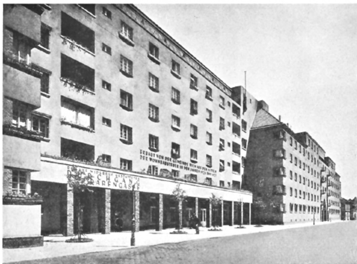
Neue Wohnhausanlage, III. Bez., auf den Gründen der ehemaligen Krimsky-Kaserne (Front Baumgasse)