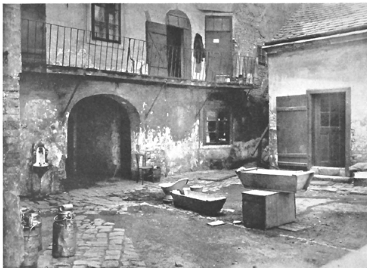
Haus, III. Bez., Baumgasse 41 (alter Bestand)