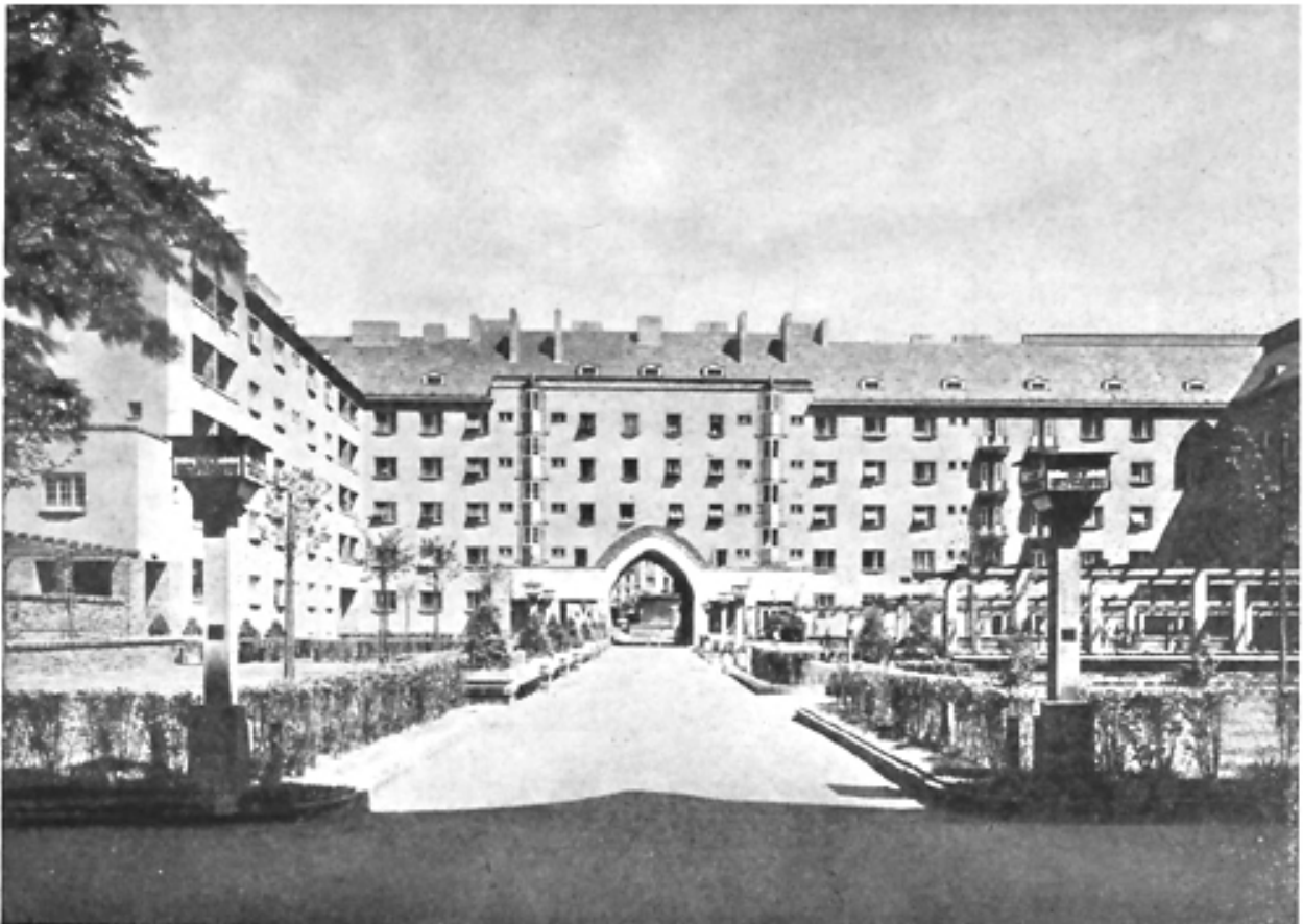
Neue Wohnhausanlage, III. Bez., auf den Gründen der ehemaligen Krimsky-Kaserne (Blick gegen die Gartenseite des Traktes Hainburgerstraße)