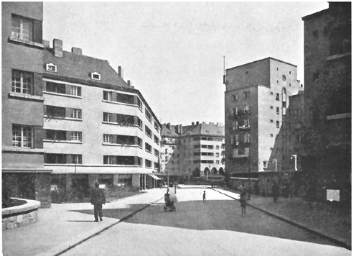
Neue Wohnhausanlage, III. Bez., auf den Gründen der ehemaligen Krimsky-Kaserne (Rabengasse)