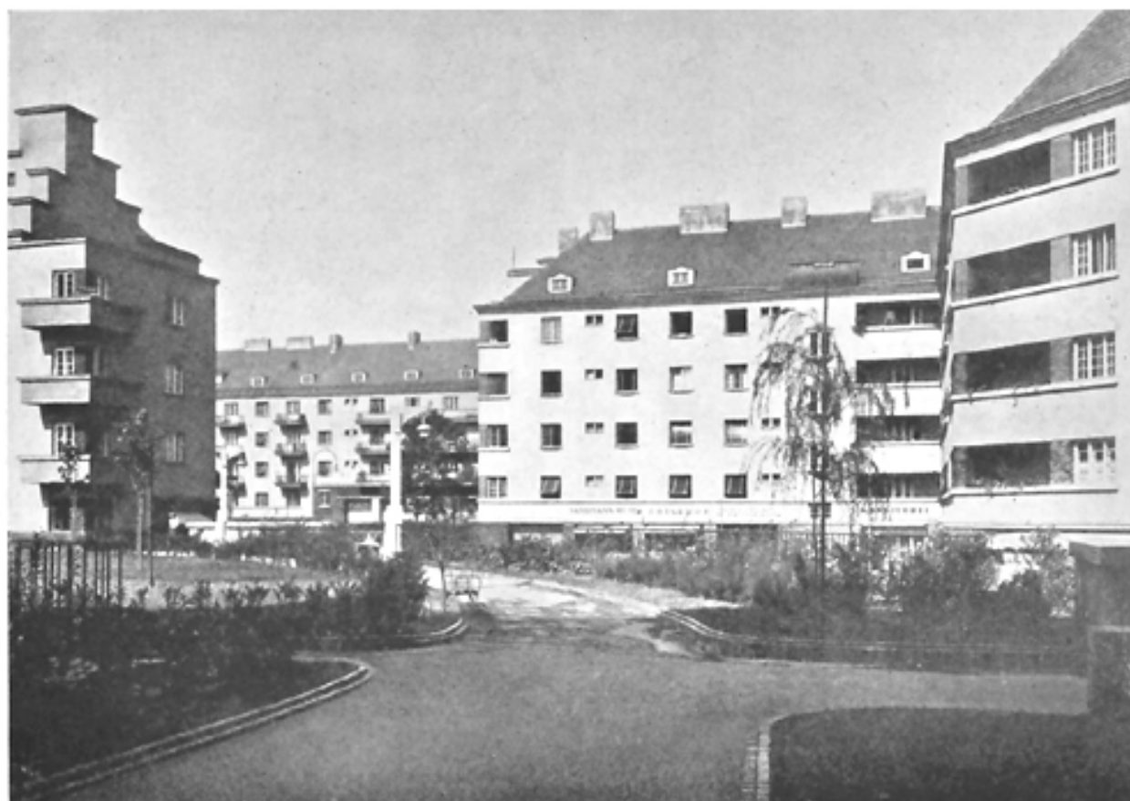
Neue Wohnhausanlage, III. Bez., auf den Gründen der ehemaligen Krimsky-Kaserne (Blick von der Terrasse gegen die Rabengasse)