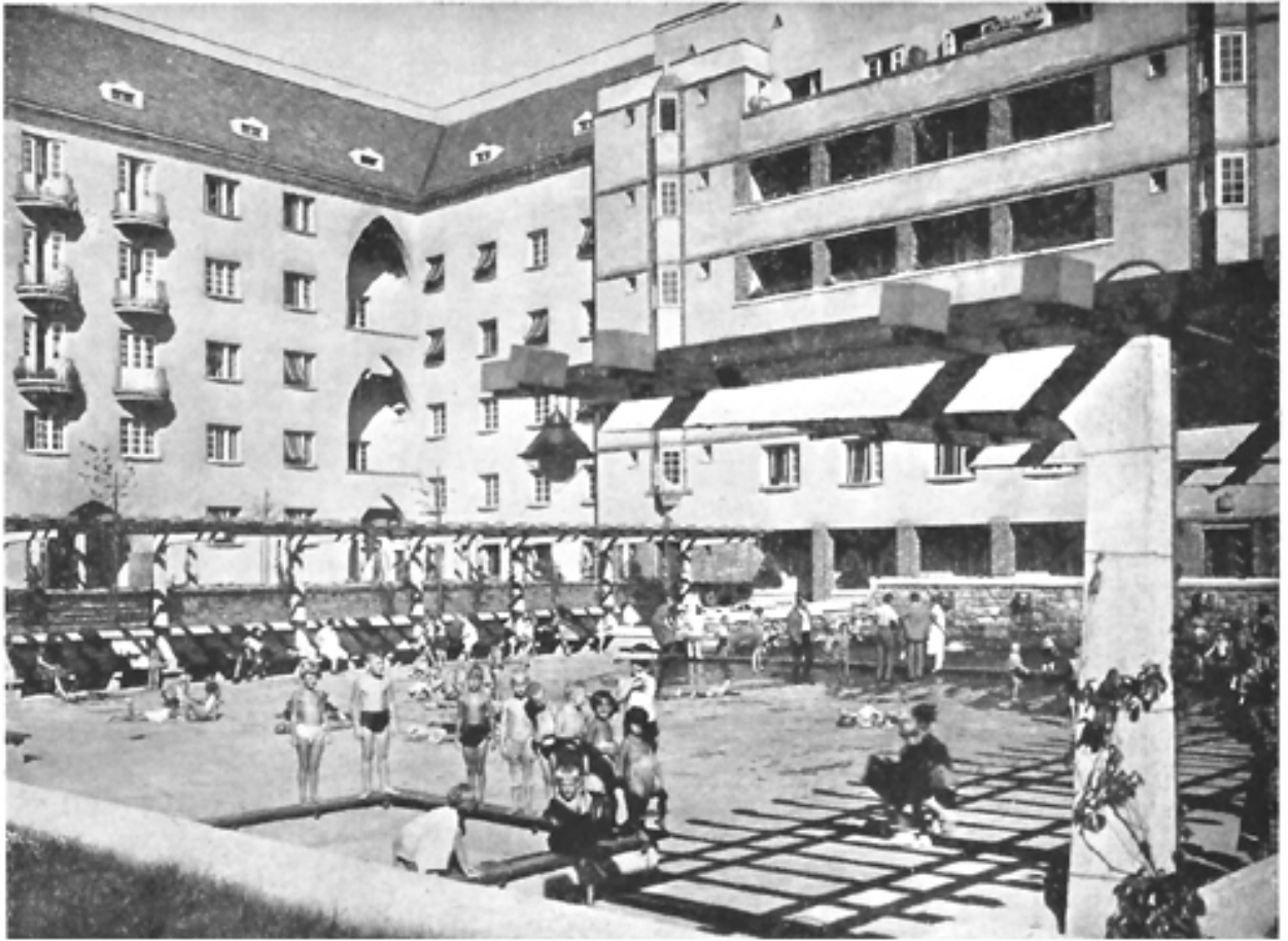
Neue Wohnhausanlage, III. Bez., auf den Gründen der ehemaligen Krimsky-Kaserne (Planschbecken im großen Hof)