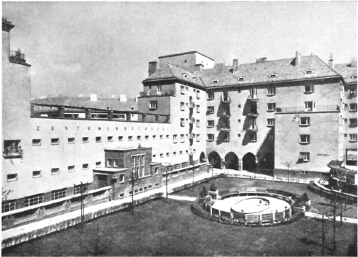
Neue Wohnhausanlage, III. Bez., auf den Gründen der ehemaligen Krimsky-Kaserne (Blick gegen die Zentralwäscherei)