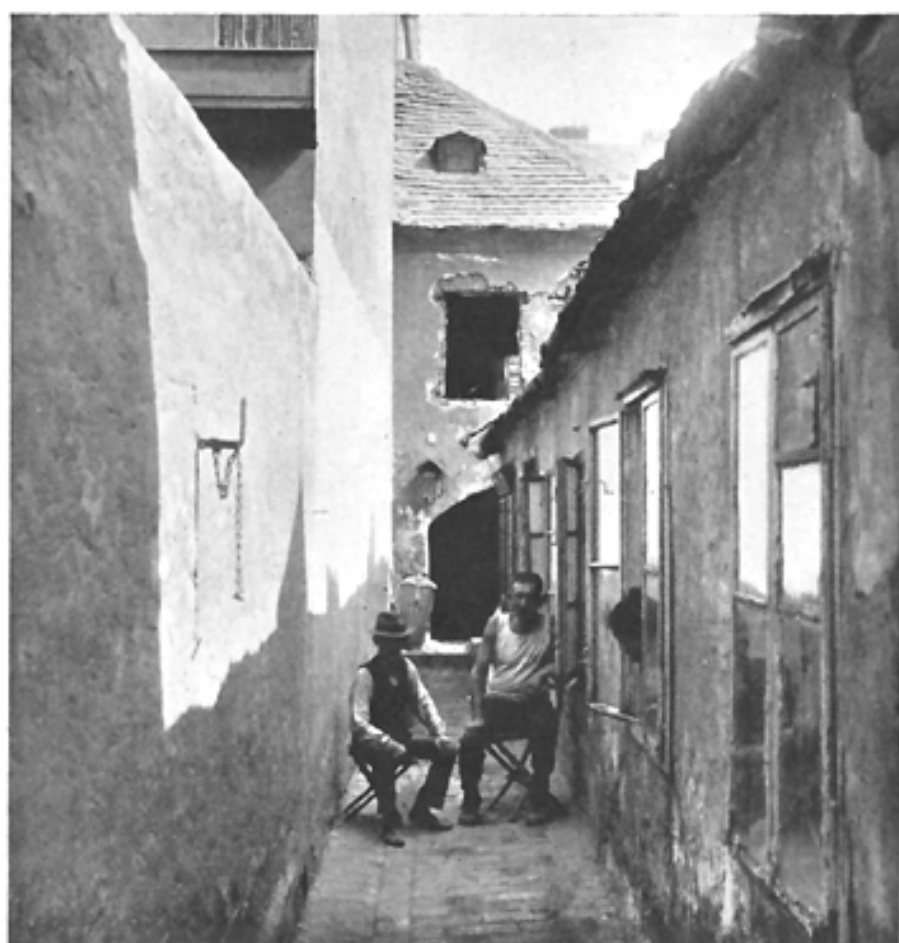
Haus, III. Bez., Hainburgerstraße (alter Bestand)