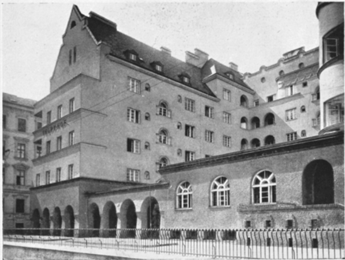
Hauptansicht Marktgasse mit Blick in den Straßenhof