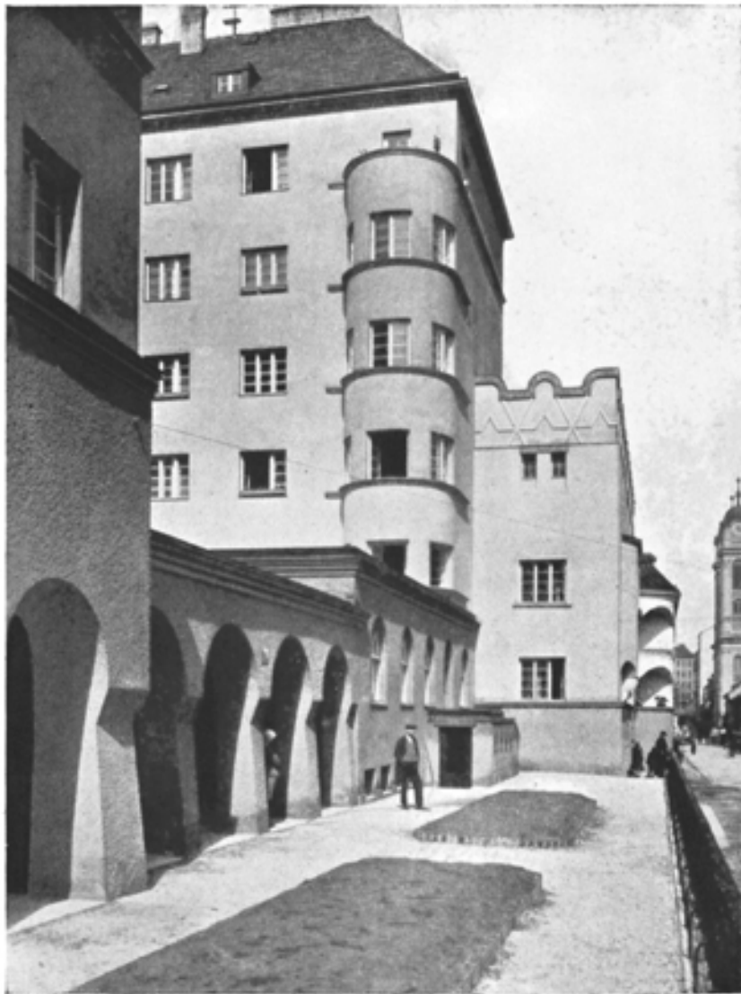
Teilansicht Marktgasse mit Arkaden