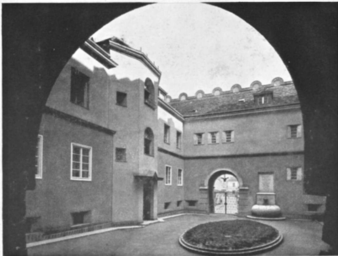
Teilansicht des Durchgangshofes Fechtgasse