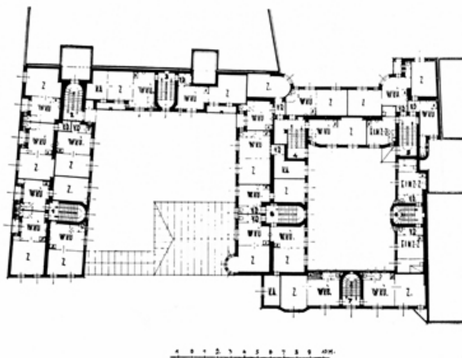
Grundriß 1. Stock