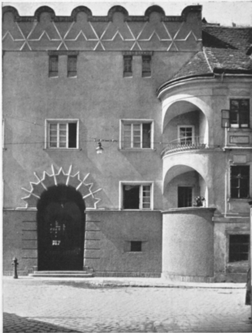
Teilansicht Marktgasse mit Durchgang Fechtergasse