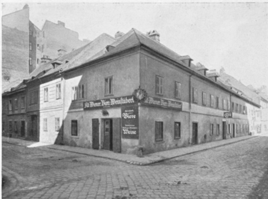
Häuser vom alten „Thury-Grund“