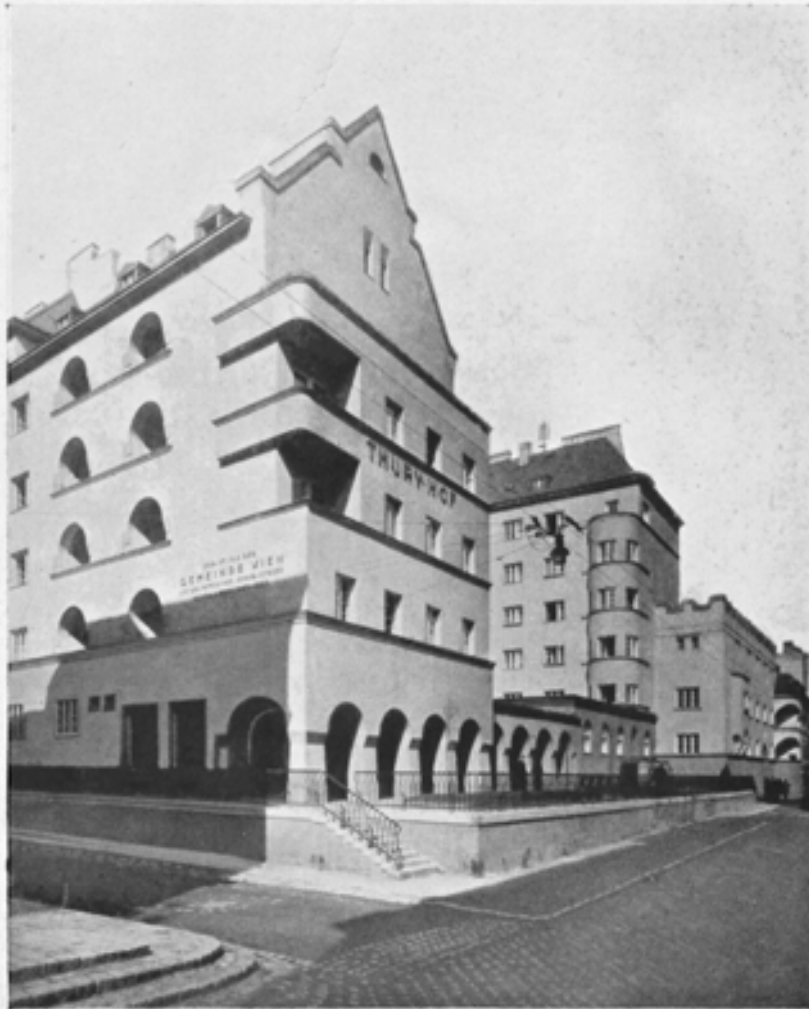
Ansicht Thurygasse, Ecke Marktgasse