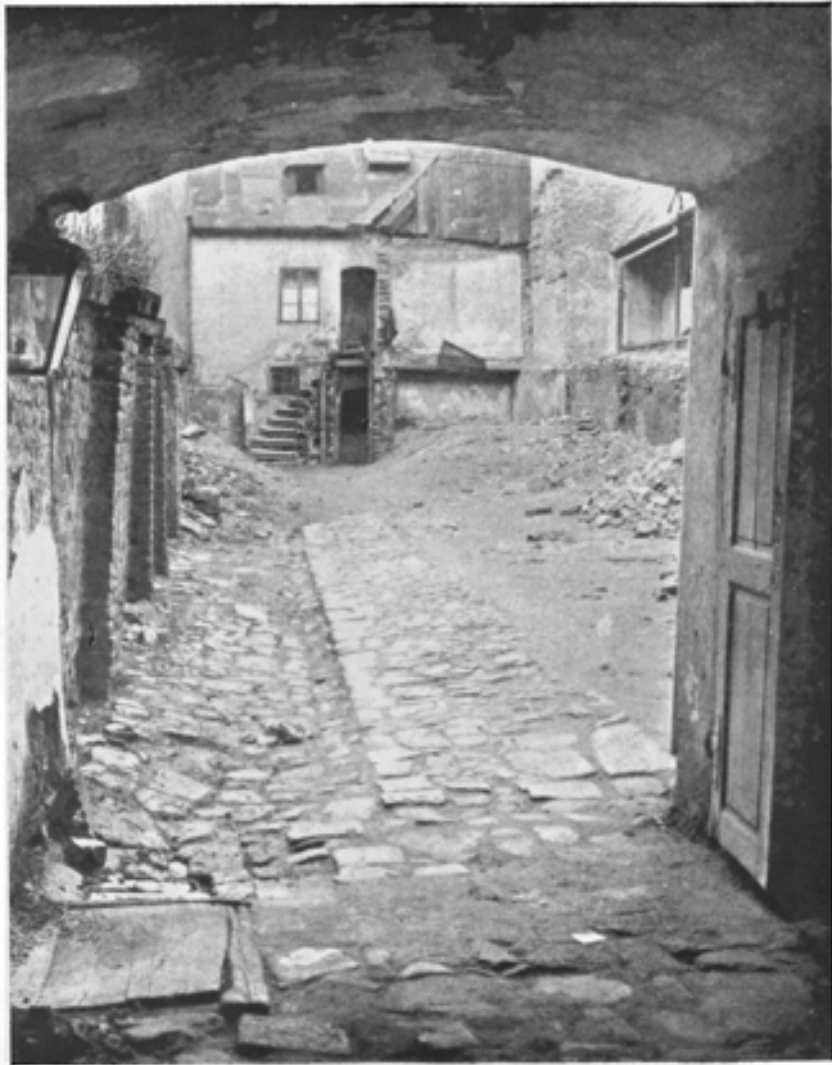
Blick in einen alten Haus- hof am „Thury-Grund“