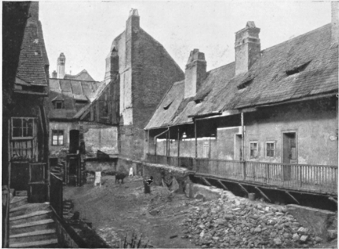
Ein Haushof am alten „Thury-Grund“