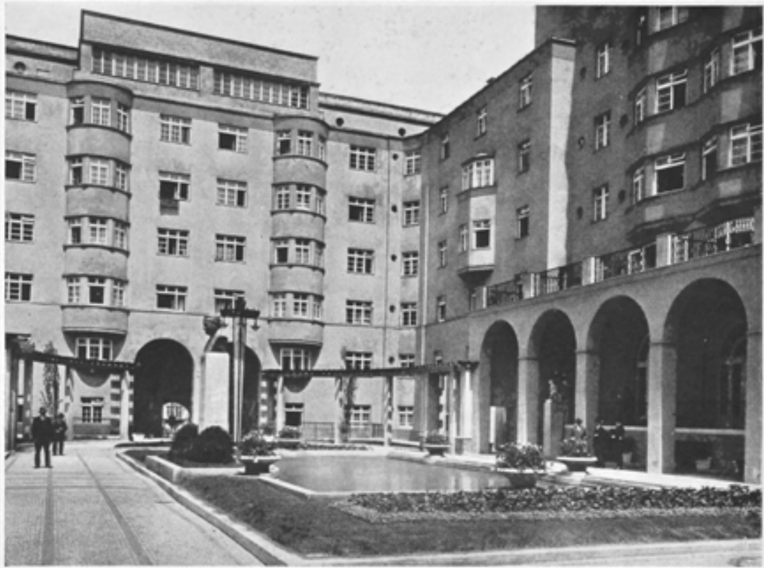
Wohnhausbau Margarethengürtel—Reumannhof Ansicht des Straßenhofes mit Reumannbüste und Wasserbecken